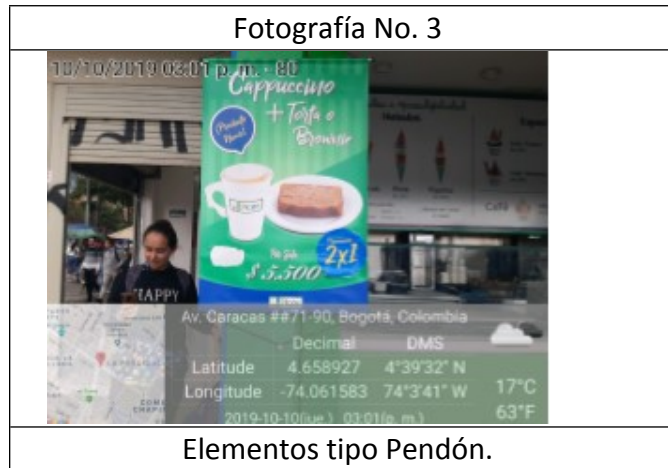
Elementos tipo Pendón.